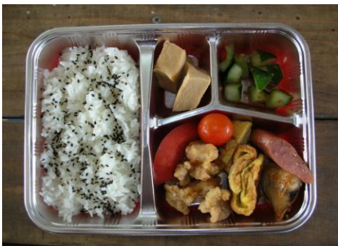
手作り弁当でお出かけします