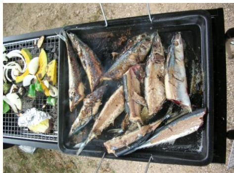
秋には炭火で旬を焼きました

美味しいものが食べたいが カロリーが気になる…。 どうしても間食がやめられない！