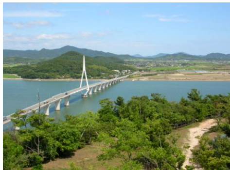
天気いい日にはドライブ♪