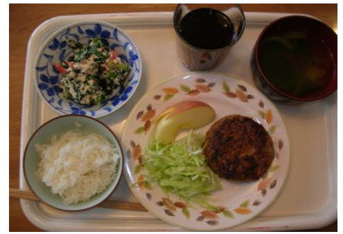
おふくろの味で勝負！