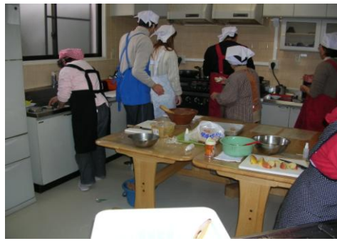
みんなでやっています♪

→毎日午前 10 時 45 分ごろから 行っている調理訓練でお待ちし ております。 料理を全くしたことが無くても 問題ありません。まずは見るだけ でもOKです！