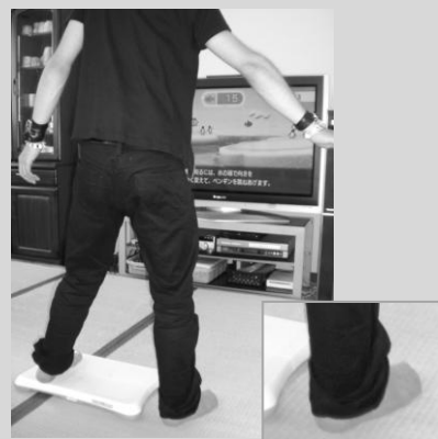
神の足の瞬間を激写＝デイケアセンター

精神科の外来医療費（診察、薬、デイケア、外来作業療法、訪問看護などにかかる費用）が 1割負担になる制度 です。加えて収入に応じて 毎月上限額 が設定されます（上限額なしの場合もあります）。 通院によってかかる費用を少しでも軽くすることができます。制度をご存じない方もいらっしゃるかと思いますので、詳しくは主治医、ケースワーカーにご相談下さい。