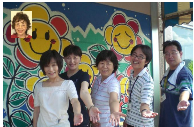
「おいでませ〜デイケアへ。」

この6月から週1回だったデイナイトが週2回に増えたこともあり、デイナイト中心にデイケアの紹介をさせていただきます。