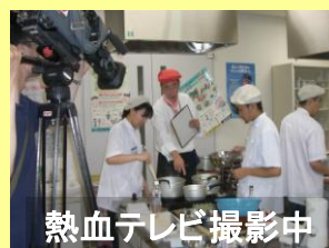
熱血テレビ撮影中