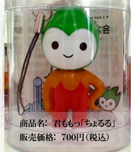
商品名: 君ももっ「ちよるる」 販売価格: 700円(税込)

フィオーレも、「おいでませ!山口大会」ちよるるの広場(メイン会場:維新百年記念公園)に出店予定となっております。(乞うご期待)